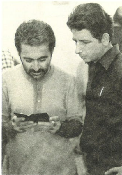
ΟΙ ΣΥΓΓΕΝΕΙΣ ΤΩΝ ΑΓΝΟΟΥΜΕΝΩΝ ΔΕΙΚΝΟΥΝ ΤΙΣ ΦΩΤΟΓΡΑΦΙΕΣ ΤΟΥΣ ΣΤΟΥΣ ΑΙΧΜΑΛΩΤΟΥΣ, ΜΕ ΤΗΝ ΕΛΠΙΔΑ ΟΤΙ ΚΑΠΟΙΟΣ ΑΠΟ ΑΥΤΟΥΣ ΘΑ ΑΝΑΓΝΩΡΙΣΕΙ ΤΟ ΔΙΚΟ ΤΟΥΣ.

Η σωστή καταγραφή του προβλήματος των αγνοουμένων θα έπρεπε να αποτελέσει το πρώτο βήμα της προσπάθειας για διακρίβωση της τύχης τους και στη βάση αυτών των πληροφοριών θα έπρεπε να μεθοδευτεί η προσπάθεια για την ανεύρεσή τους. Για όσους ήταν νεκροί και θαμμένοι στις ελεύθερες περιοχές έπρεπε να ενημερωθούν οι δικοί τους και να τους παραδοθούν τα λείψανά τους. Για όσους υπήρχαν αξιόπιστες μαρ- τυρίες ότι σκοτώθηκαν στις μάχες και τάφηκαν στα κατεχόμενα έπρεπε να ενημερωθούν οι συγγενείς τους ότι είναι νεκροί και να διεκδικηθεί